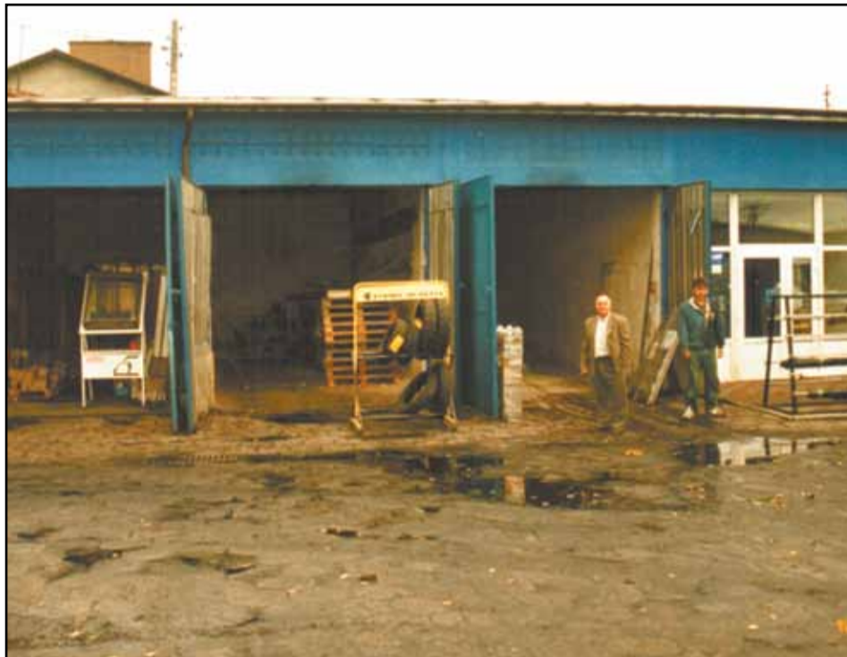
Budynki przed remontem

Mamy wszystko, co potrzebne. Współpracujemy z wieloma dużymi firmami, takimi jak Kovala, Cersanit, Śnieżka, trudno wymienić wszystkie. Jeżeli chodzi o narzędzia, współpracujemy ze sklepem Atmo, który ma 138