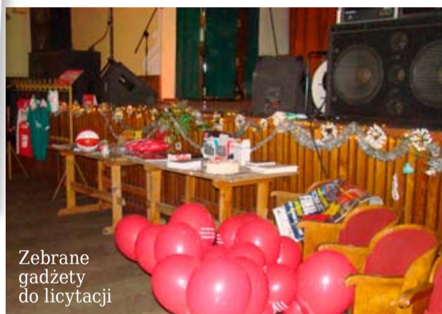
Zebrane gadzety do licytacji