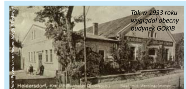
Tak w 1933 roku wyglądał obecny budynek GOKiB

się z siedmiu modułów, w których prezentowanych jest pięć części kreskówek. Każda z kreskówek omawia różne zagrożenie, które może spotkać najmłodszych internautów. Morał każdego odcinka prezentowanego jest przez znanego wszystkim - Krzysztofa Hołowczyca. Oprócz tej niezwykle przydatnej wiedzy, chroniącej nasze dzieci, każda biblioteka, która bierze udział w tej kampanii, może wziąć udział w konkursie, w którym do wygrania są atrakcyjne nagrody, między innymi pięć konsol do Xbox 360 z sensorem Kinect oraz pięć urządzeń tBook-7200 - czytników elektronicznych książek z funkcją odtwarzacza multimedialnego. Więcej informacji można uzyskać w Gminnej Bibliotece Publicznej w Łagiewnikach. Zapraszamy wszystkich do udziału!