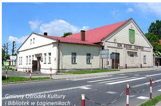
Gminny Ośrodek Kultury i Bibliotek w Łagiewnikach