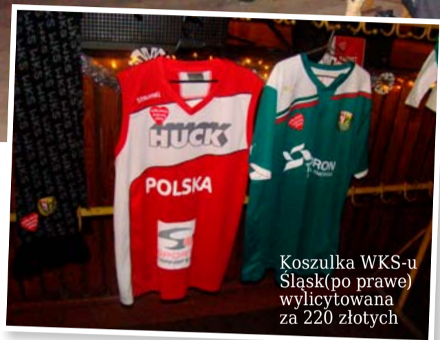
Koszulka WKS-u Śląsk (po prawe) wylicytowana za 220 złotych

Tegoroczny, XX finał WOSP, można uznać w Łagiewnikach za niezwykle udany. Z uzyskanych przez nas informacji wynika, że Łagiewniki zebrali w tym roku 17 tysięcy złotych. W kolejnych dniach informacja ta może zmienić się, ponieważ są to jedynie wstępne podliczenia.