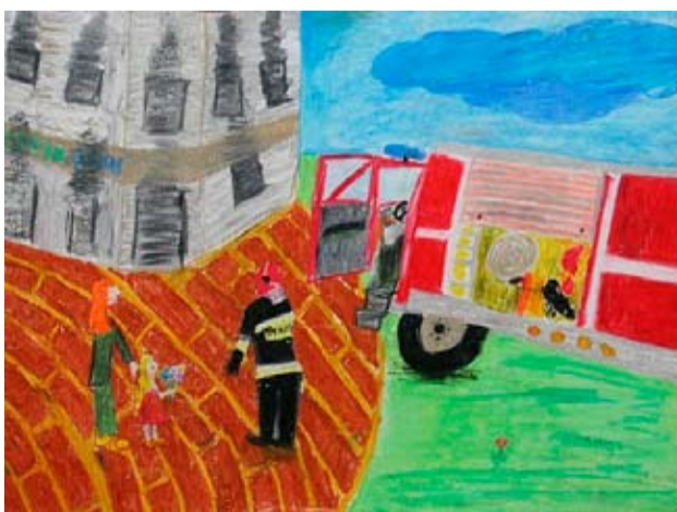
Prace laureatów XIII Ogólnopolskiego Konkursu Plastycznego