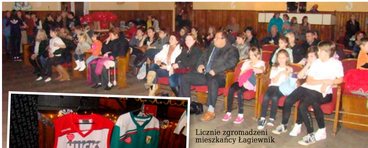
Licznie zgromadzeni mieszkańcy Łagiewnik