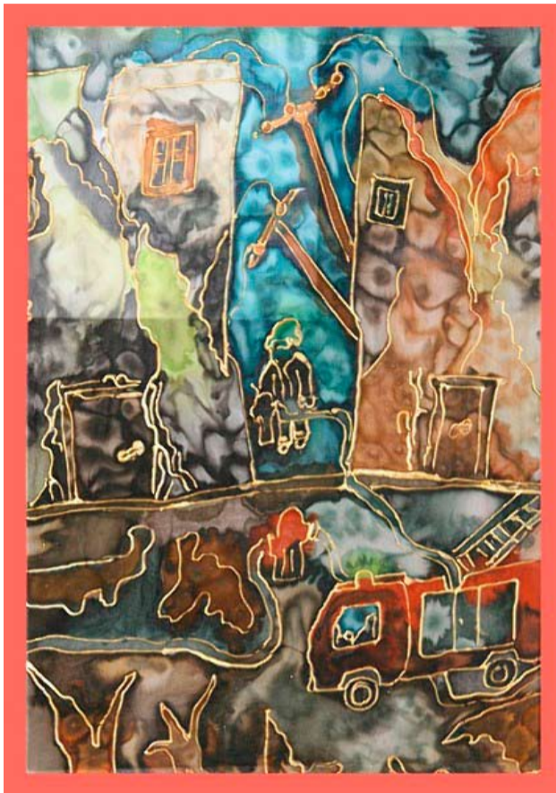
Zwycięska praca ucznia z Piławy Górnej

oraz ostatnia – IV grupa – wychowankowie świetlic terapeutycznych i ośrodków terapii zajęciowej, w tej ostatniej grupie nie ma żadnych ograniczeń wiekowych. Eliminacje odbywają się na kilku szczeblach. Najpierw są eliminacje gminne, z których zostanie wyłonionych po pięć najlepszych