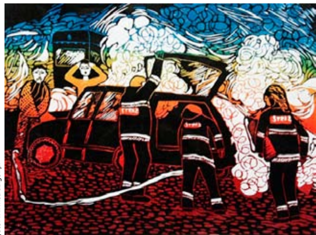
Niezwykle piękne prace uczestników zeszłorocznej edycji konkursu

prac z każdej z 4 wyżej wymienionych grup wiekowych. Drugim szczeblem eliminacji są eliminacje powiatowe, a trzecim wojewódzkie. Aby poszczególne