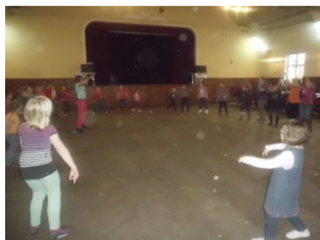
uczestnicy malowali świecz-

W programie tegorocznego spotkania odbyły się warsztaty artystyczne, w czasie których