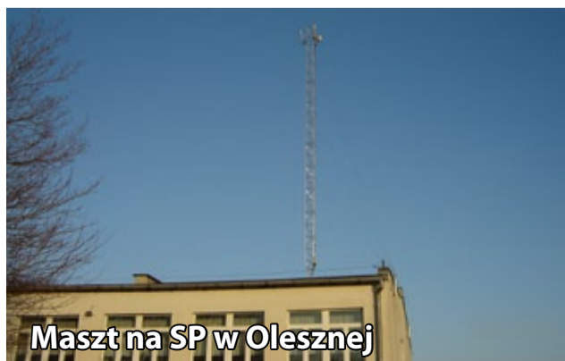
Maszt na SP w Olesznej